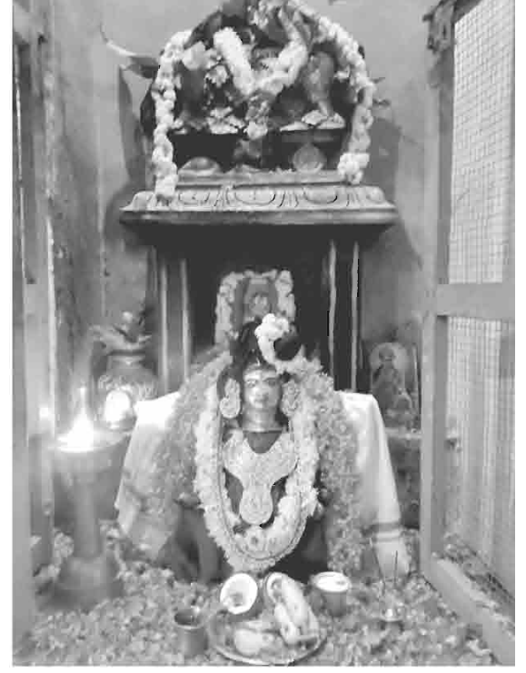
வரலக்ஷ்மி நோன்பு அன்று அரூப மகாலக்ஷ்மி அலங்கரித்திருக்கும் காட்சி