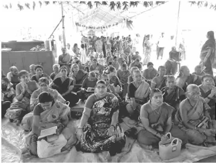
ஆடிபூரத்தன்று சுவாசினிகள் லலிதா நமஸ்காரம்பாராயணம் செய்யும் காட்சி