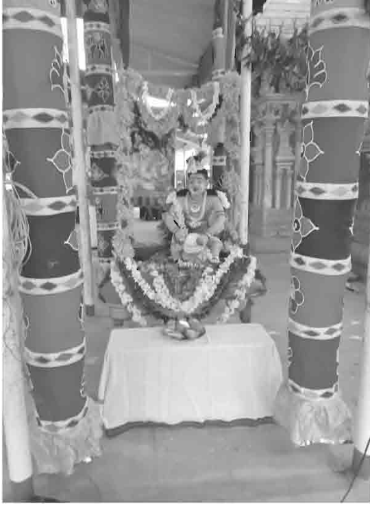
கிருஷ்ண ஜெயந்தியன்று கிருஷ்ணரை அலங்கரித்திருக்கும் காட்சி