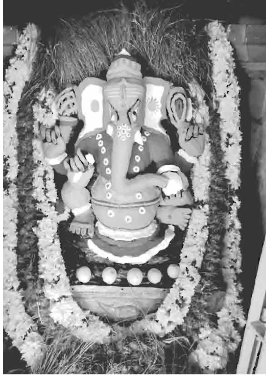
விநாயகர் சதுர்த்தியன்று சுந்தர கணபதியை அலங்கரித்திருக்கும் காட்சி